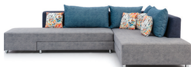
Sedacia súprava P*(166x202) 1. balík - 230x110x68 cm (1,72m 3 , 93kg) 2. balík - 150x110x68 cm (1,12m 3 , 39,5kg)